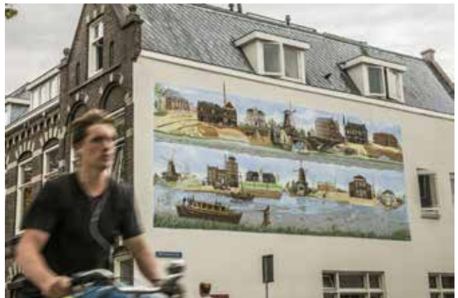
Rechts: Muurschildering door Jos Peeters. Jutfaseweg 121.