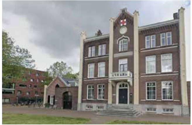
Rechts: Dit pand aan de Jutfaseweg is gebouwd voor de Amaliastichting, de opleiding voor verpleegsters van het Rode Kruis. Het was later het Tandheelkundig Instituut.