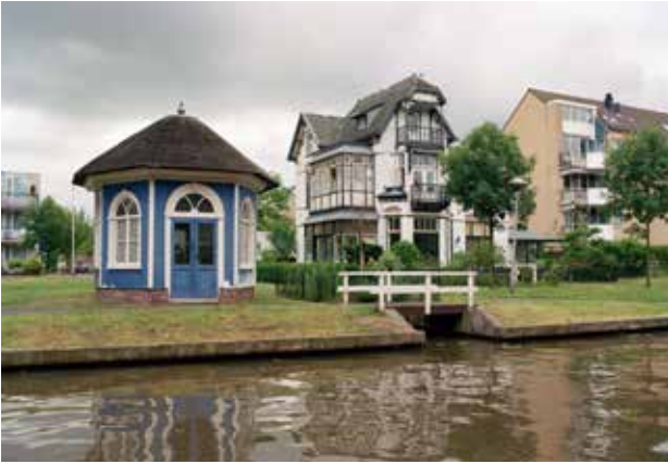
Links: De gerestaureerde theekepel langs de Vaartsche Rijn. Net te zien vanaf de brug hoek Jutfaseweg 't Goylaan; maakte deel uit van buitenplaats Ruimzicht.