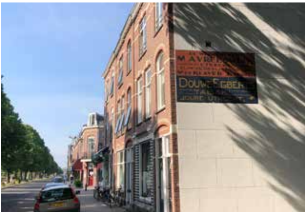
links: Jutfaseweg met gerestaureerde reclameschildering.