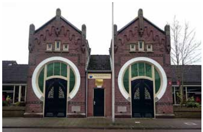
Deze school is gebouwd als school van de Nederlands Hervormde Gemeente, de naam werd later W.G. van der Hulstschool en is nu De Wereldwijzer.