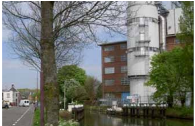
Links: De Batavier.