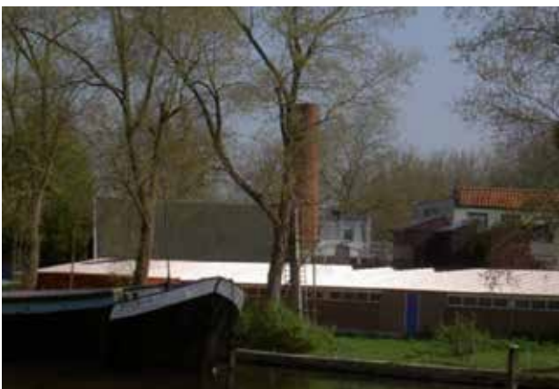
Links: Schoorsteen van voormalig Wasserij Hoeksema met omringende gebouwen op de 'taartpunt', gezien vanaf het Merwedekanaal.