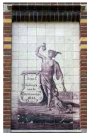
Tegelfabriek Westraven en de tegeltableaus op het pand aan de Jutfaseweg 178.