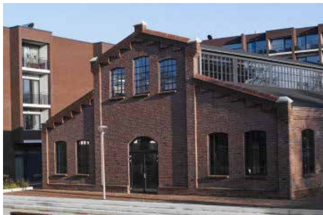
Links: U.M.S /Pastoe. Helemaal links is de watertoren te zien. Rechts: Machinefabriek De Klop herbouwd in 2018