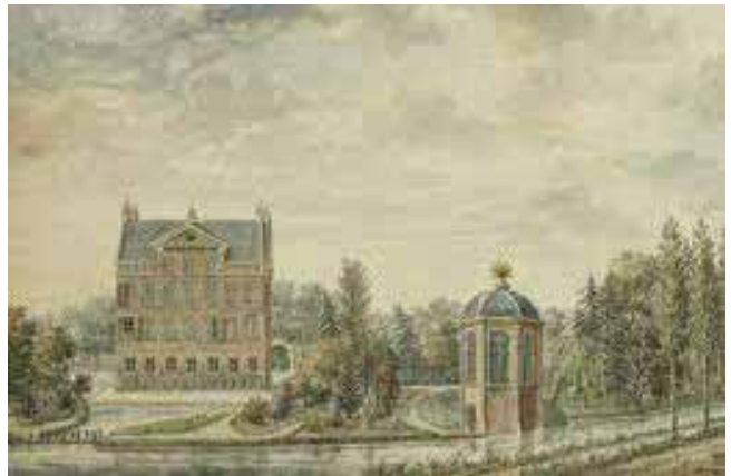
Huis De Wiers met rechts op de voorgrond de Vaartse Rijn en het jaagpad. Aquarel van C. de Jonker uit ca. 1751.